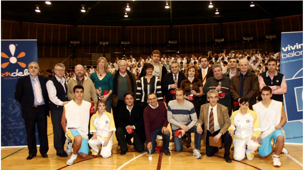
Foto de familia de los premiados 2006.