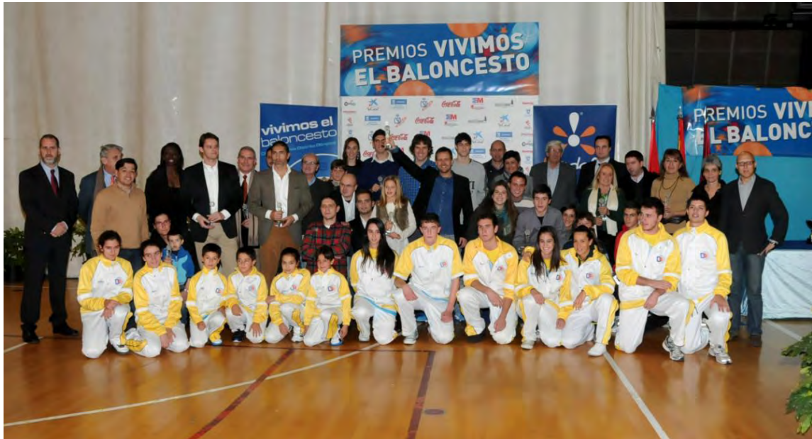
FOTO DE FAMILIA, de los galardonados en esta Edición.. Los mejores jugadores en competiciones de la FBM en la temporada 2010/2011 junto a los premiados institucionales, premios especiales del jurado y autoridades invitadas para la entrega de trofeos. Junto a ellos una representación de los jugadores de Distrito Olímpico.