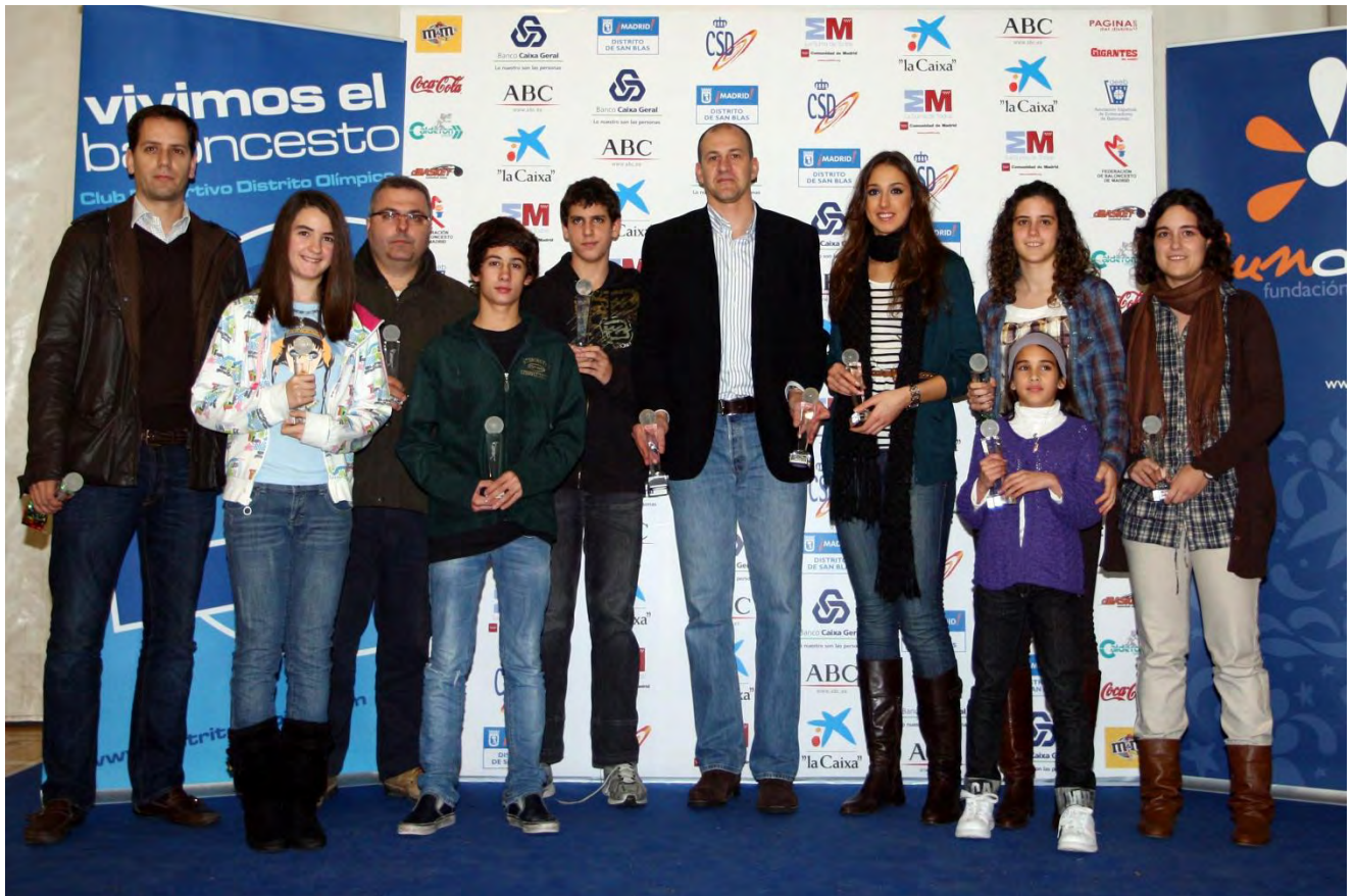
FOTO DE FAMILIA, de los mejores jugadores y jugadoras de la Comunidad de Madrid durante la temporada 2008-2009.