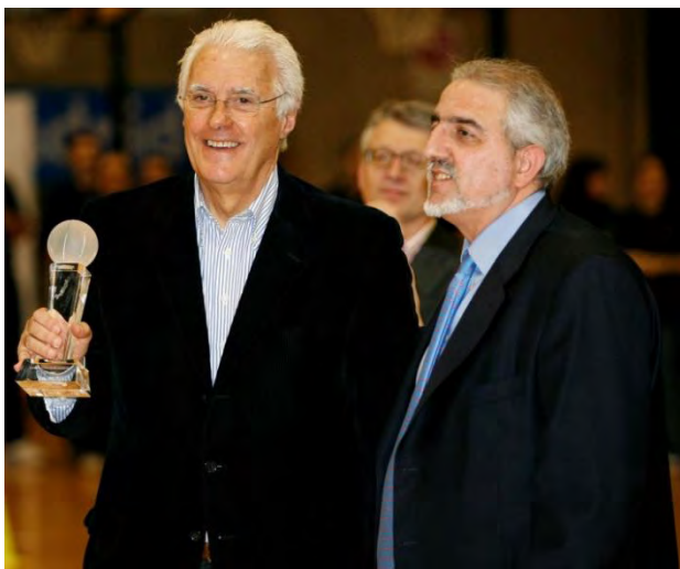
PREMIO TODA UNA VIDA, a la trayectoria en la dirección técnica.

Lolo Sainz, ex entrenador del Real Madrid, Joventut de Badalona y Selección Nacional , por su amplísimo trabajo en el entorno del baloncesto español desde sus comienzos como entrenador de base en 1969 hasta la actualidad.