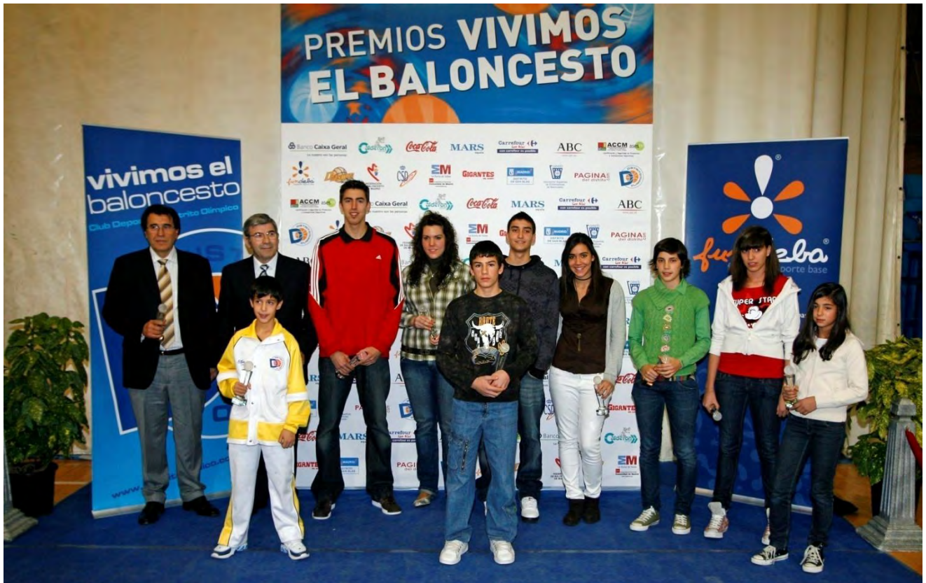
FOTO DE FAMILIA , de los mejores jugadores y jugadoras de la Comunidad de Madrid durante la temporada 2007-2008.