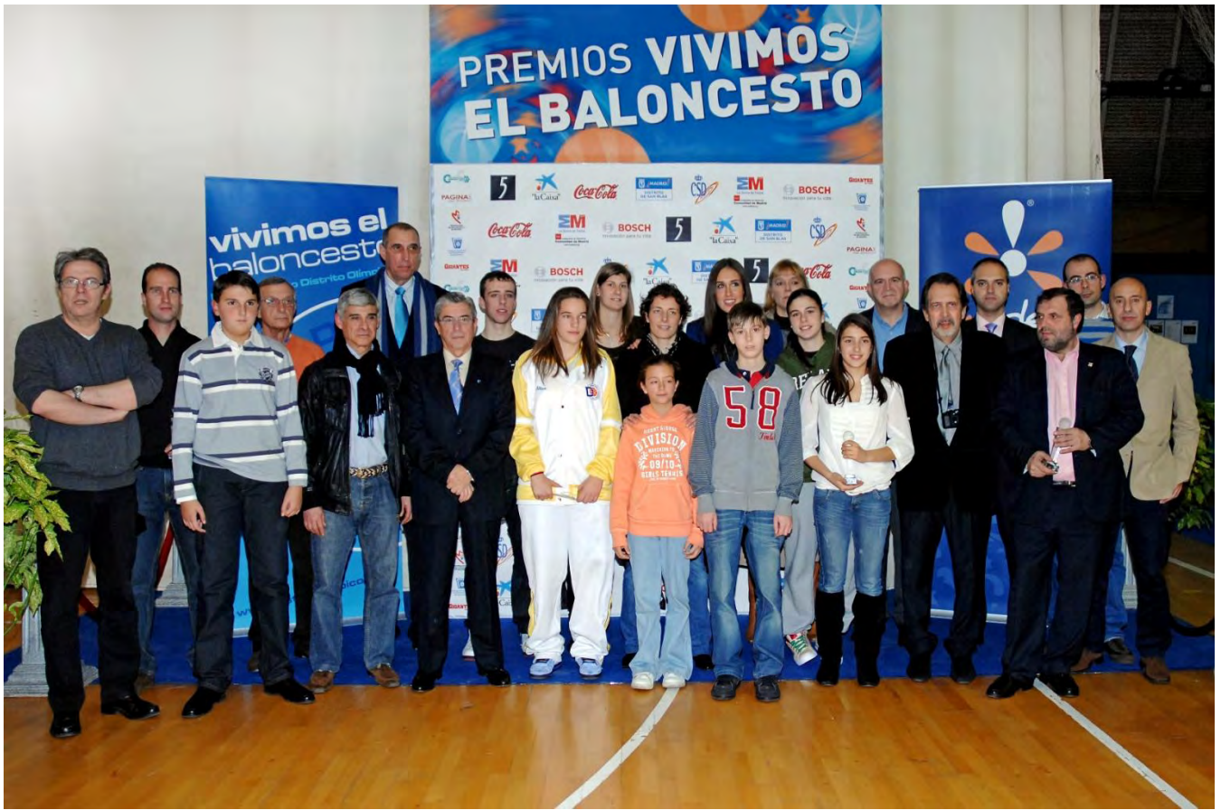
FOTO DE FAMILIA, de los galardonados en esta Edición..