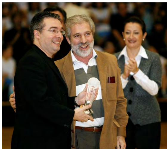
MEDIO DE COMUNICACIÓN, al más destacado durante 2007 por su tarea informativa sobre el baloncesto.

Lolo Sainz, ex entrenador del Real Madrid, Joventut de Badalona y Selección Nacional , por su amplísimo trabajo en el entorno del baloncesto español desde sus comienzos como entrenador de base en 1969 hasta la actualidad.