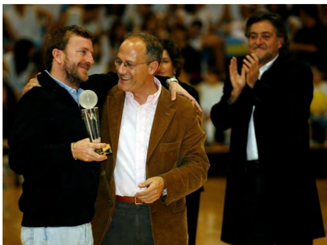
CENTRO EDUCATIVO, por su trayectoria en su apuesta por el baloncesto como deporte principal de su ideario educativo.

La Sexta , por la firme apuesta de esta Cadena por dotar de una amplia cobertura a los campeonatos de Europa masculino y femenino, y colaborar con el desarrollo de las categorías de base mediante su condición de socio FEB. Recogió el premio Antonio Galeano, director de deportes.