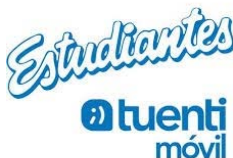
TUENTI MOVIL ESTUDIANTES 'A'