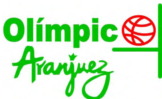
OLIMPICO ARANJUEZ "A"