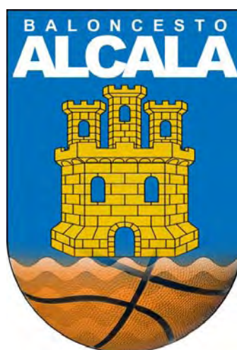
BALONCESTO ALCALA 'B'