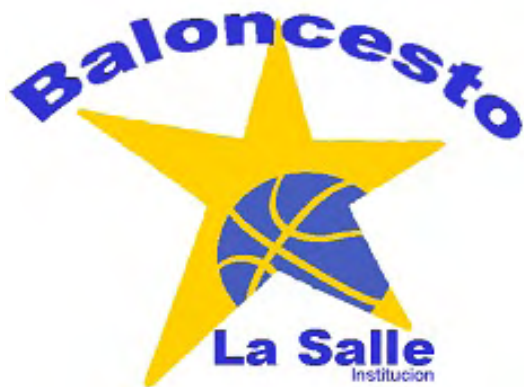
BALONCESTO 86 LA SALLE