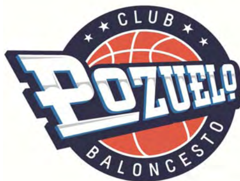
POZUELO C.B. "B"