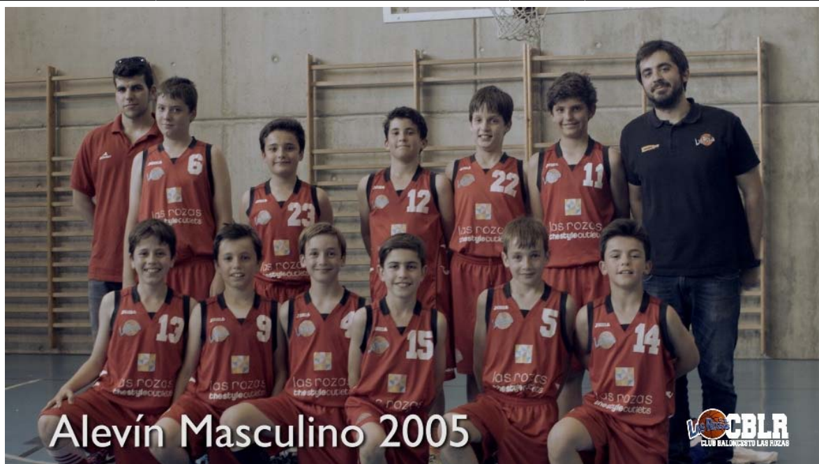
Alevín Masculino 2005