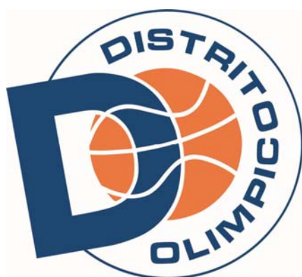
PLENILUNIO D.O. 'A'