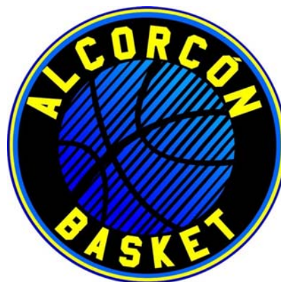
ALCORCON BASKET 'A'