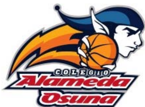
COLEGIO ALAMEDA DE OSUNA ROJO