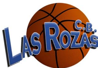
C.B. LAS ROZAS THE STYLE OUTLETS