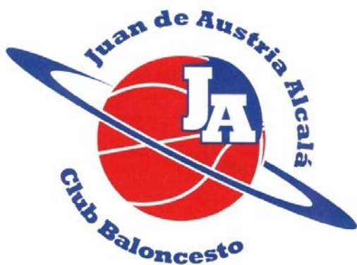
RICOPIA FUNBAL ALCALA