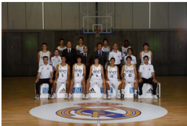
El Real Madrid A defiende el liderato ante el equipo B

En el resto de grupos, atrae especialmente el choque del grupo E entre el Distrito Olímpico , segundo clasificado, y el San Agustín A , líder invicto. Los visitantes vienen de arrollar al Alcorcón por 71 puntos de diferencia (132-61). La cita es en el Polideportivo Municipal de San Blas el domingo a las 16:30 h.