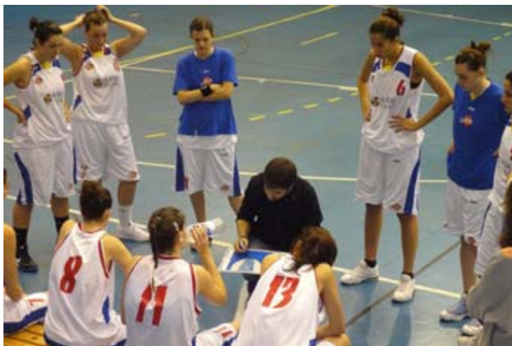
Las Rozas Village mantiene su pulso con el Pozuelo

Los 29 puntos de diferencia (82-53) mostraron la diferencia que hay ahora mismo entre los dos equipos. El Femenino Alcorcón también sigue aspirando a la Final a Cuatro gracias a su triunfo frente al Bodybell Arganda por 72-57. Mucho más igualado fue el duelo