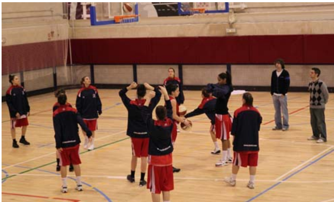
El CREF ¡Hola! Alameda de Osuna A se enfrenta al equipo B en octavos