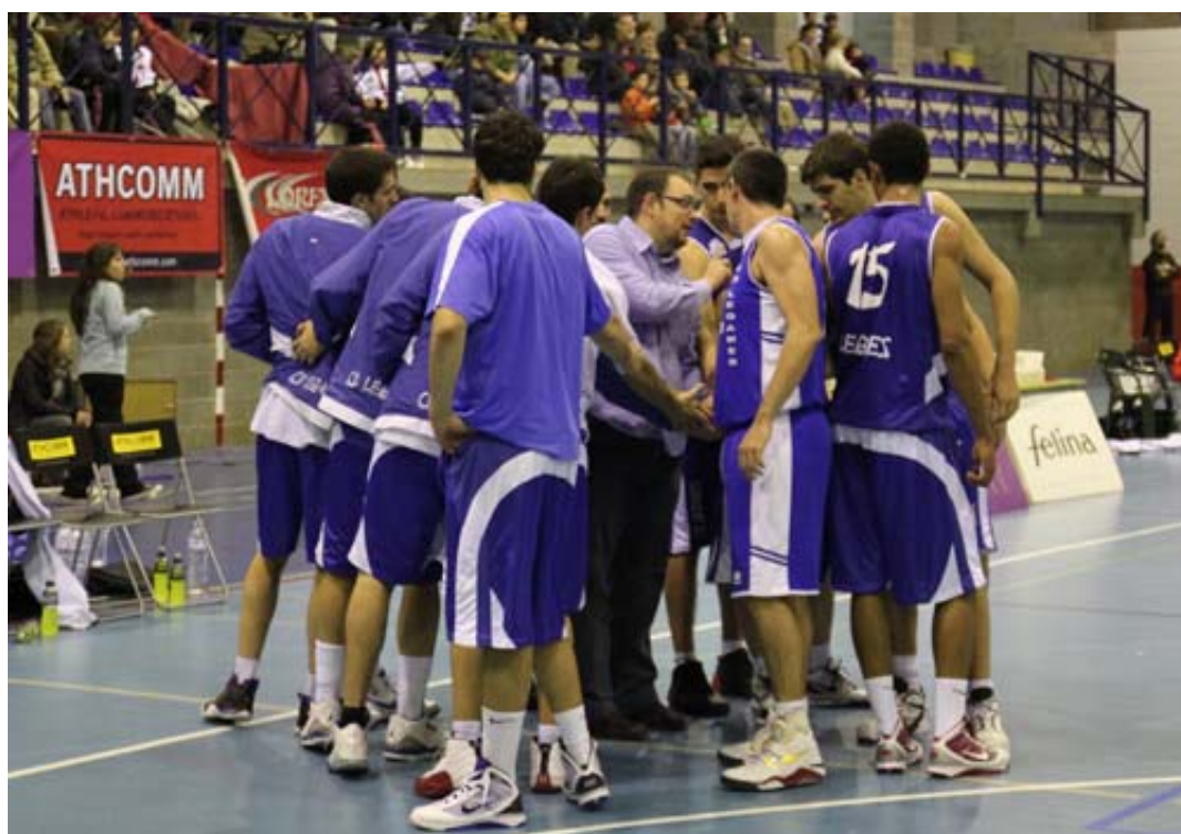
El Piel de Toro Leganés intentará dar la sorpresa ante el potente Covibarges Rivas