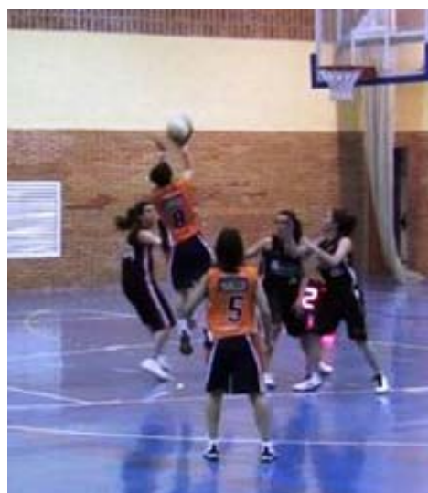
El Bodybell Arganda (en la imagen, ante el Espacio Torrelodones) aún lucha por mantener la categoría

Otro partido con mucho en juego es el que se disputará en el pabellón El Torreón del Pozuelo (sábado, 18:00 h.) entre las locales y el Fundal Alcobendas . El Pozuelo se ha mostrado imprevisible en esta recta final (cinco derrotas en los últimos seis partidos) mientras que el Fundal Alcobendas necesita la victoria para asegurarse la salvación. Y otro equipo que está a un triunfo de su objetivo es el Distrito Olímpico . Después de enlazar ocho victorias seguidas, las de San Blas deben dar ante el Espacio Torrelodones el último paso para asegurar su presencia en la Final a Cuatro. La cita, el domingo a las 17:30 h. La jornada se cierra con el choque entre el Joyfe y el ya descendido Fuenlabrada (domingo, 19:00 h.)