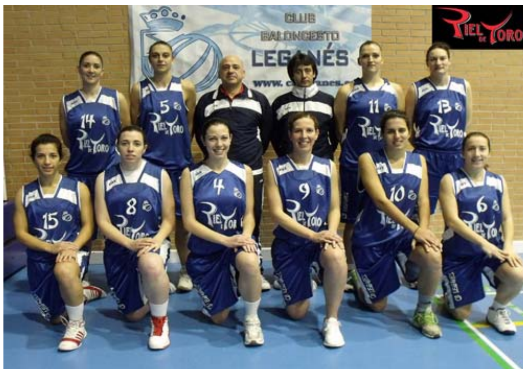
El Piel de Toro Leganés defiende el liderato ante el Distrito Olímpico

obstáculo para asegurarse la primera plaza, ya que en la última jornada visitará al Hercesa , otro conjunto duro de pelar, sobre todo en su feudo. Para añadir más interés a esta recta final, Las Rozas Village recibe en esta penúltima jornada al Femenino Alcorcón , uno de los cuatro equipos (junto a Leganés , Hercesa y Pozuelo ) que han derrotado a las roceñas, ya que se impuso en la primera vuelta por un apretado 46-41.