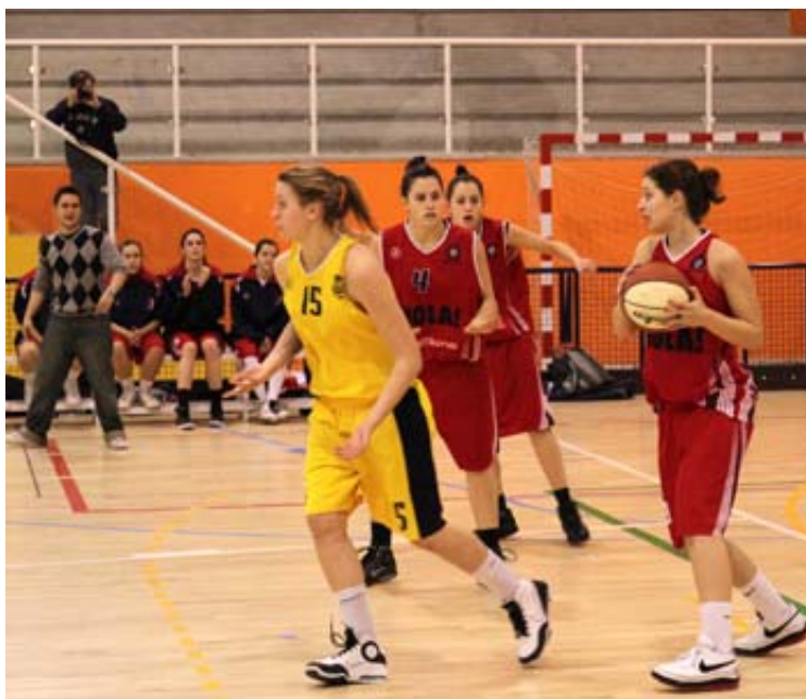
El CREF (en la imagen, en un partido contra el Canoe) tiene un duro adversario en el Covibar Rivas

sigue el orden lógico, el Estudiantes debería pasar por la vía rápida y esperar al vencedor de la eliminatoria entre el CREF ¡Hola! Alameda de Osuna y el Covibar Rivas Ecópolis , que se presenta como uno de los enfrentamientos más igualados de esta ronda. Nadie quería a las ripeñas como rival en los playoff. Aunque el CREF ha demostrado que es uno de los equipos más fuertes de la categoría (junto a Canoe y Estudiantes ), Rivas superó la segunda fase con diez victorias de diez partidos y confirmó su potencial ante el Pozuelo en octavos por lo que ya suma doce de doce. El primer partido se disputará el viernes (19:15 h.) en el Colegio Alameda de Osuna; el segundo, en Rivas el sábado (19:30 h.) y el tercero, si hace falta, será el domingo a las 13:00 h.