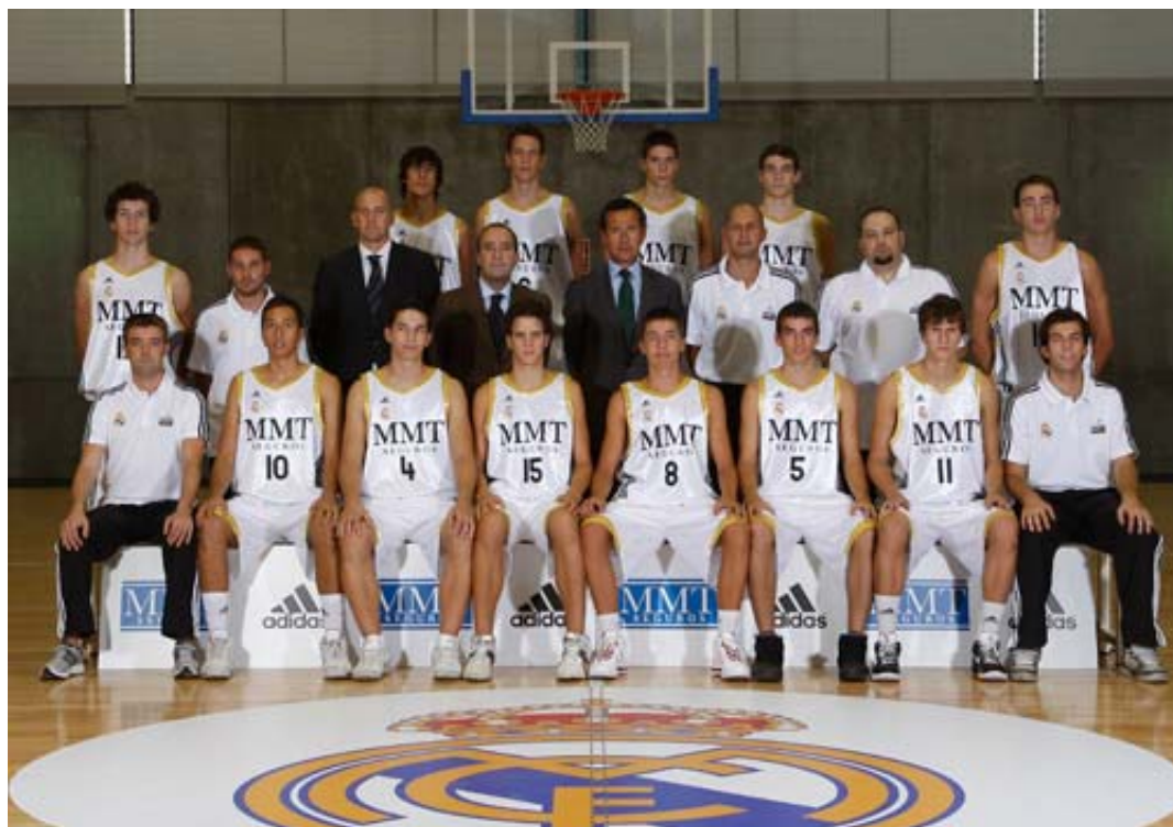
El Real Madrid cayó ante el Baloncesto Torrejón y no estará en la Fase Final

Después de tres días intensos, en los que se disputaron nueve partidos de cuartos, ya se conocen los equipos que disputarán la Fase Final el próximo fin de semana. Serán Asefa Estudiantes , Olímpico 64 , Baloncesto Torrejón y European Basketball College Majadahonda . Los colegiales eliminaron a otro de los 'históricos' del baloncesto madrileño, el Real Canoe , al imponerse por 91-74 en el Magariños y 85-94 en el pabellón de la calle Pez Volador. En una de las eliminatorias más igualadas, el Olímpico 64 demostró su gran momento de forma y dejó en la cuneta al Fuenlabrada pese a tener el factor cancha en contra. En la ida, los fuenlabreños cobraron ventaja por 87-84 pero en el partido de vuelta, el Olímpico supo reaccionar e igualó la serie: 77-70. En el decisivo tercer encuentro, el Olímpico 64 se impuso en el pabellón El Arroyo por 96-105.