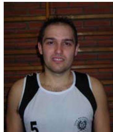
Isaac Peral, base del Coslada

Los partidos de vuelta de octavos de final confirmaron algunas de las sorpresas que ya habían comenzado a intuirse en el primer encuentro. Coslada y E. Leclerc Villa de Aranjuez rompieron el factor cancha y se clasificaron para cuartos por la vía rápida (2-0) tras eliminar, respectivamente, al Liceo Francés y el Tajamar . Los cosladeños derrotaron en el segundo partido al Liceo por 86-75 y se enfrentarán ahora al Covibarges Rivas , que cumplió el pronóstico y dejó en la cuneta al Piel de Toro Leganés : 46-81 en el segundo encuentro. Mientras, el E. Leclerc Villa de Aranjuez , sexto clasificado del grupo Impar y un equipo que, en principio, no contaba en los pronósticos, sufrió hasta el último instante pero consiguió imponerse al Tajamar , tercero del grupo Par, por 64-63.