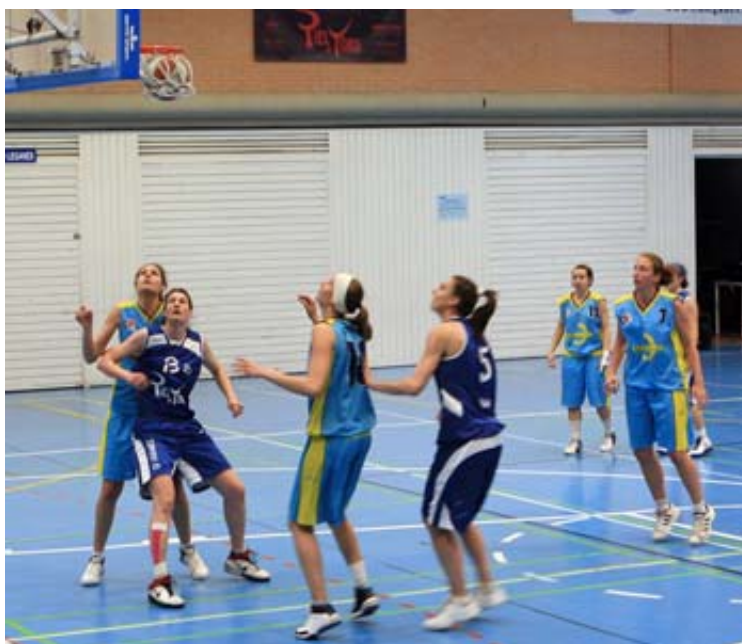
El Piel de Toro Leganés se impuso al Distrito Olímpico tras realizar una espectacular remontada en la segunda parte

El partido más desigual se celebró en Fuenlabrada , entre el cuadro local, colista con 23 derrotas, y un Pozuelo que, después de atravesar un bache hace un mes, parece volver al buen camino como demostró al vencer por 42-116. Ya sin posibilidades de entrar en la Fase Final está el Hercesa , que, pese a todo, consiguió una clara victoria en Torrelodones: 38-80. Por último, con su triunfo, 73-52, el Fundal Alcobendas se aseguró matemáticamente la permanencia a la vez que condenó al Coslada , que acompañará al Fuenlabrada a Autonómica.