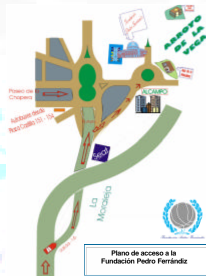
Plano de acceso a la Fundación Pedro Ferrándiz

Fundación Pedro Ferrándiz Avda. Olímpica, 22 / 28100 Alcobendas (Madrid) TLFNO. 91 662 44 71 / FAX. 91 661 90 99 www.fpferrandiz.org