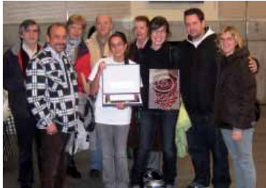
Rut con el premio recibido

y su trayectoria como voluntaria. Para la Asociación es todo un honor y un orgullo que uno de sus voluntarios reciba un reconocimiento tan importante de la valía de su trabajo