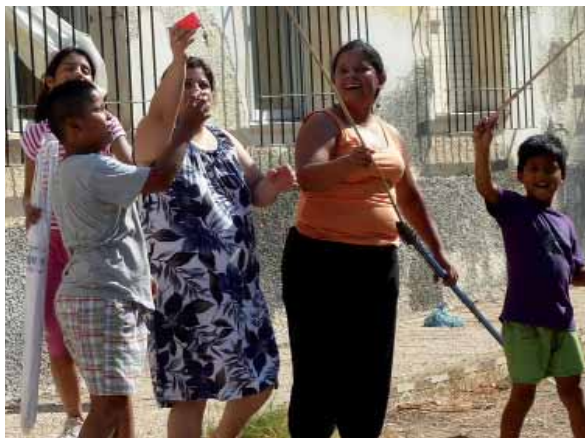
Actividades en Isla Plana

- Taller de cocina. Una vez al mes, una familia propone un plato y, en colaboración con el resto de participantes, se realiza la receta elegida.