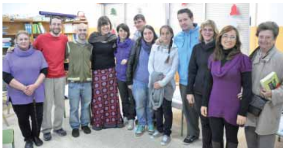
Sesión de formación del equipo 2011

L a Asociación La Torre de Hortaleza es una asociación sin ánimo de lucro que tiene por objeto la educación, el fomento del deporte, la prevención de la marginación y la inserción social.