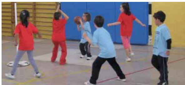
Concurso de 3x3 de Minibasket

A través del baloncesto se busca atender a la infancia, a la adolescencia, a la juventud y a las familias que se encuentran en desventaja social, familiar o económica, ya que existen muchas situaciones a