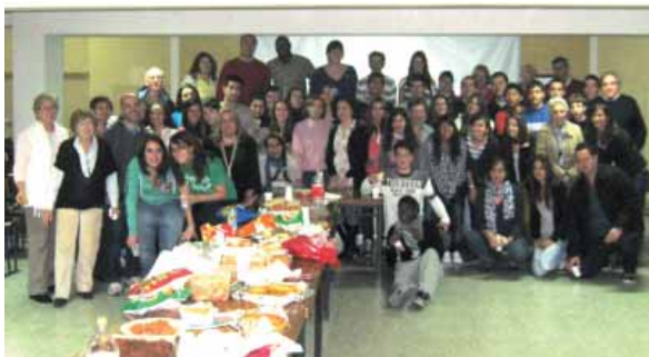
Cena "Supervivencia" 2011

una mayor amplitud de miras y una creciente diversidad en los métodos y equipos de trabajo