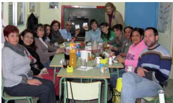
Grupo de tarde

- Gestión de recursos (juguetes en la campaña de navidad, becas de campamentos de verano, banco de alimentos...) y otras (Taichi, ...)