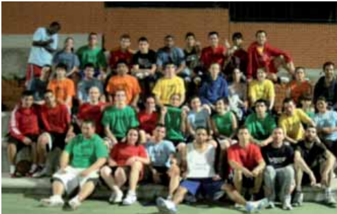
Participantes en el concurso 3x3 de mayyes

afinadas, preparadas para romper la línea de tres...25 tiros en 60 segundos, ¿cuál será el récord de triples de este año?