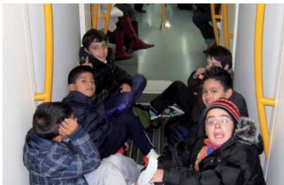
De camino a patinar

igualdad, tolerancia, respeto y aceptación de los demás.