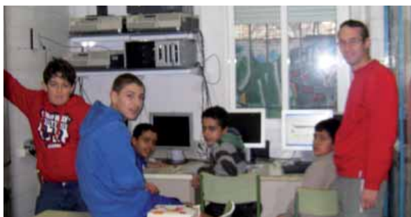
En la sala de ordenadores