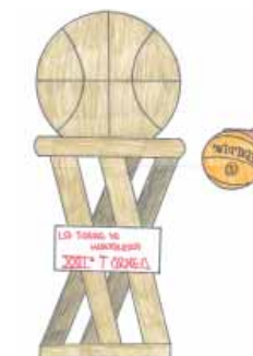
Cartel de Miguel Moral

• Infantiles y cadetes: Diferentes posiciones, 90 segundos para sumar todos los puntos posibles...sí, hablamos de nuestro “two and ball”, en el que los jugadores/