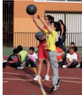
Concurso de Tiro de Minibasket

Como siempre viene ocurriendo, desde el primer Torneo celebrado,