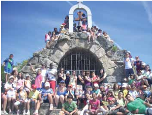
Los Molinos 2011

celebra la llegada de las fiestas navideñas. Se prepara un completo programa de