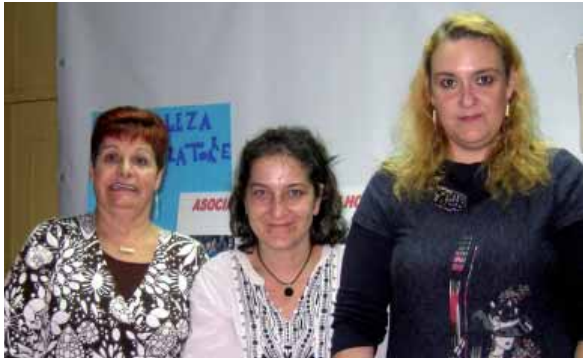
Colaboración de familias en mercadillo

vista personal como del social y familiar. Más específicamente, a través de este proyecto se busca: