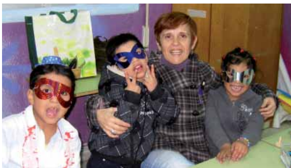
Niños durante la reunión de familias

El objetivo general de este proyecto es que todas las familias de la Asociación reciban una orientación pluridisciplinar para contribuir al desarrollo integral de cada miembro de la familia, tanto desde el punto de