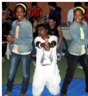
Fiesta de la Convivencia 2011

Asimismo, se realizarán diversos TALLERES con el objetivo de fomentar la diversidad, la integración y la tolerancia. Se tratará de diversas actividades centradas en enfoques de sensibilización, reflexión y participación, sin olvi-