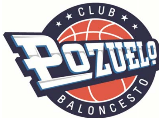
POZUELO C.B. 'C'