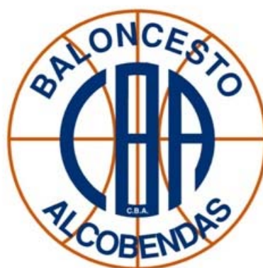
FUNDAL ALCOBENDAS 'C'