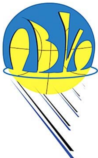
VILLAVICIOSA DE ODON AZUL