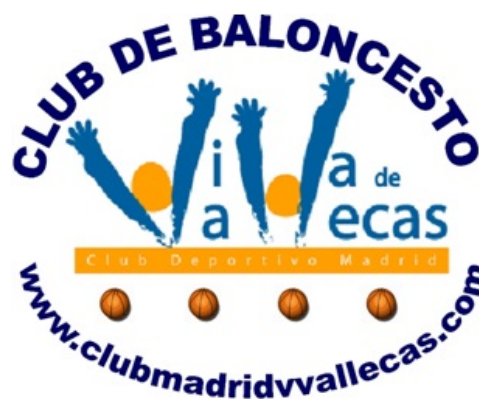
MADRID VILLA DE VALLECAS AZUL