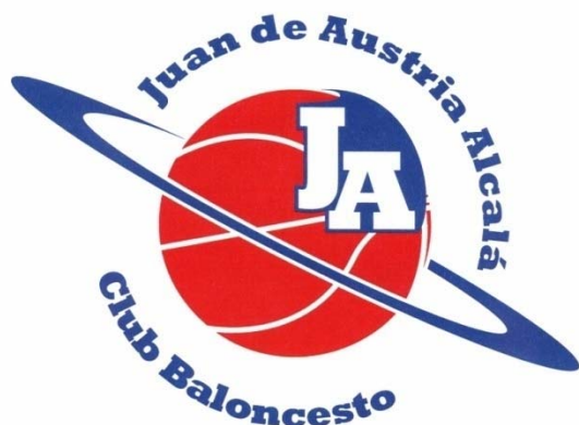
RICOPIA FUNBAL ALCALÁ MORADO