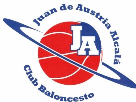
RICOPIA FUNBAL ALCALÁ