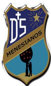
Colegio Menesiano Madrid