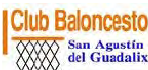
SAN AGUSTIN DEL GUADALIX