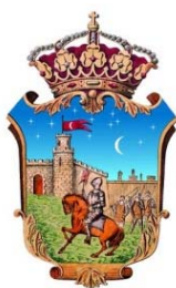
AYUNTAMIENTO DE GUADALAJARA

La VII edición del Campus de Verano "Vivimos el Baloncesto" no sería posible sin la colaboración de: