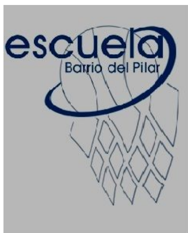
ESCUELA BARRIO DEL PILAR