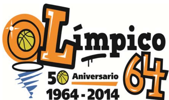
OLIMPICO 64 COLEGIO SANTA GEMA 'A'