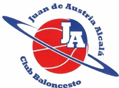
RICOPIA FUNBAL ALCALA