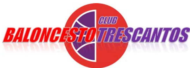
TRES CANTOS 'A'