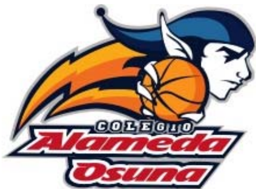
COLEGIO ALAMEDA DE OSUNA