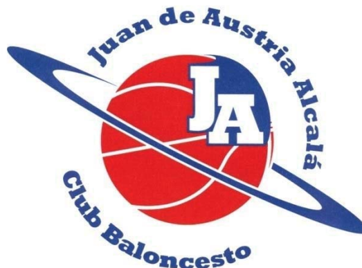
RICOPIA FUNBAL ALCALÁ CBJA