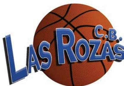
CAMPUS HERNANGÓMEZ ROZAS A