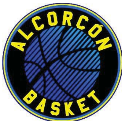
ALCORCÓN BASKET A