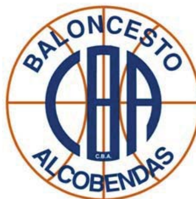
FUNDAL ALCOBENDAS NARANJA