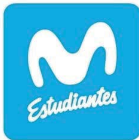
MOVISTAR ESTUDIANTES MARIANA