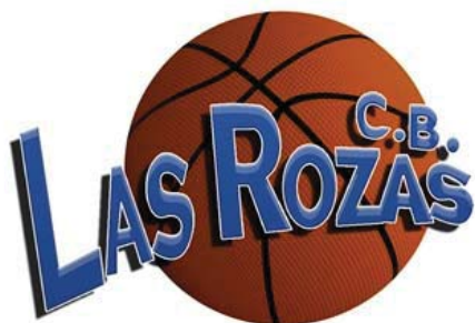
CHESTERFIELD CENTRE LAS ROZAS