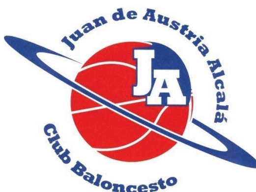
RICOPIA FUNBAL ALCALÁ CBJA MORADO