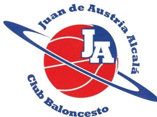
RICOPIA FUNBAL ALCALÁ CBJA