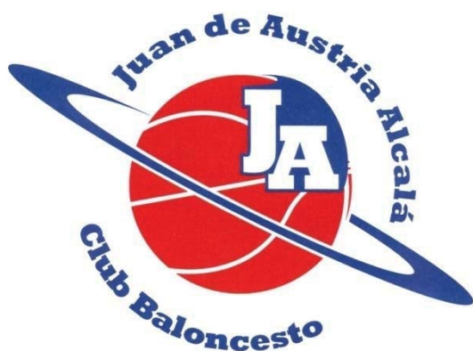
RICOPIA FUNBAL ALCALÁ