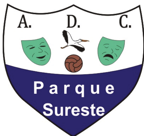
RIVAS PARQUE SURESTE