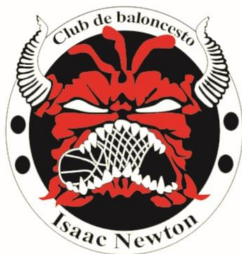
CLUB DE BALONCESTO ISAAC NEWTON