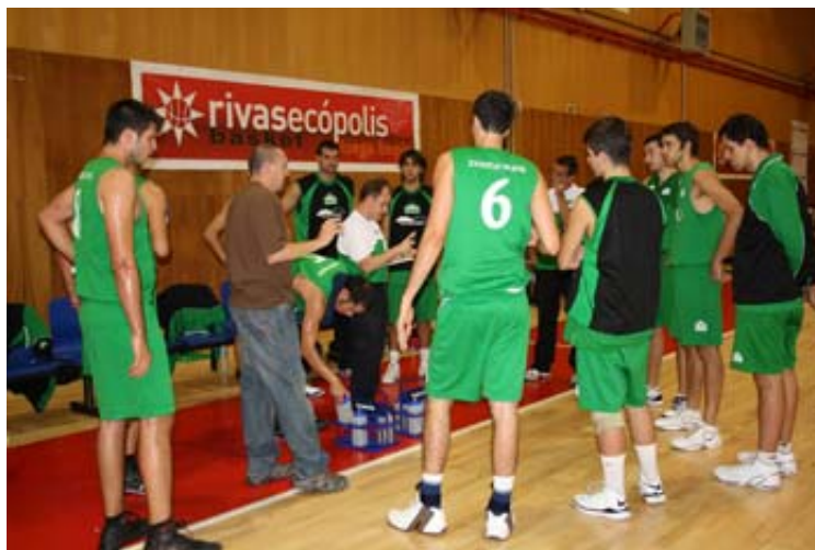
El Covibarges Rivas defiende el liderato del grupo ante el San Agustín del Guadalix

podría calificarse como engañosa, ya que el Zona Press es el penúltimo clasificado pero ha enlazado tres victorias consecutivas (domingo, 19:30 h.). El Distrito Olímpico intentará reponerse de su derrota frente al líder contra el Verdecora ADC Boadilla , un conjunto sumido en una profunda crisis de resultados. El encuentro se disputará el sábado a las 18:00 h. Otro equipo que necesita enderezar su rumbo es Las Rozas que, después de perder sus últimos cinco partidos, visitará el domingo (19:00 h.) al Juan de Austria , también necesitado. Por último, el Arcangel Rafael , colista con sólo tres victorias, recibirá el sábado a las 20:30 h. al La Paz CD Parla .