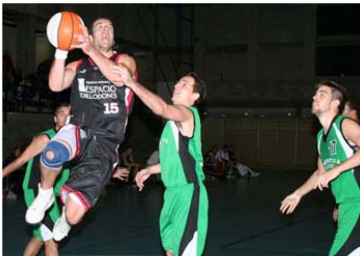
Espacio Torreldones no debe relajarse ante Piel de Toro Leganés

los tres primeros clasificados juegan en casa ante equipos teóricamente asequibles. Quizá el que más difícil podría tenerlo es el Espacio Torreldones , que recibirá el sábado a las 19:00 h. al Piel de Toro Leganés , séptimo clasificado con ocho victorias. Tras sufrir dos derrotas ante el Estudio y el Baloncesto Torrejón , los torresanos han retomado el vuelo en los dos últimos partidos. A esa reacción ha contribuido en gran medida la incorporación del base serbio Filip Samojlovic, que se ha adaptado a su nuevo equipo en un tiempo récord. En el último encuentro, ante el Juventud Madrid (55-100), el Torreldones demostró que ha recuperado sus señas de identidad: una fuerte defensa y rapidez en las transiciones.