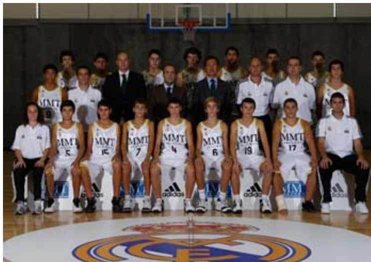
El Real Madrid recibe al Asefa Estudiantes B.

que enlaza dos victorias consecutivas, una de ellas ante el Canoe , y podría plantar cara al líder. El encuentro se jugará en el pabellón de Torrelozones el sábado a las 16:30 h. Mientras, el Asefa Estudiantes A debería cosechar, el sábado a las 11:00 h., su quinta victoria de esta segunda fase ante el Estudio A , que sólo ha logrado una victoria, allá por la primera jornada. El tercer partido enfrentará, el sábado a las 10:45 h., al Distrito Olímpico y el Canoe , con pronóstico visitante.