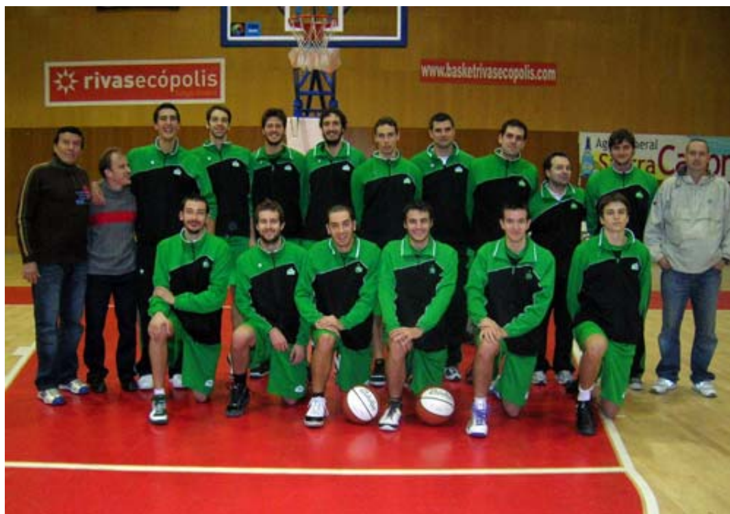
El Covibarges Rivas parte como favorito ante el Hercesa

El Grupo Par afronta las últimas jornadas partido en dos, con ocho equipos ya virtualmente clasificados para octavos y otros cuatro que tienen un pie en la fase de descenso. Todos los encuentros se disputarán el sábado a las 20:00 h. Uno de los más igualados es el que enfrentará a La Paz CD Parla (7º) con el Coslada (4º). Ambos equipos tienen ya una plaza asegurada en octavos y su objetivo ahora es buscar un buen cruce. En cambio, el Verdecora ADC Boadilla y Las Rozas , ambos con nueve victorias, no tienen asegurado todavía matemáticamente el pasaporte para la siguiente ronda.