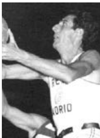
19/10/2022 Francisco Capel

Entrenador del Real Madrid durante 13 temporadas (de 1959 a 1975), en las que conquistó 4 Copas de Europa, 12 Ligas y 11 Copas de España. También fue seleccionador nacional. Falleció a los 93 años en Alicante.