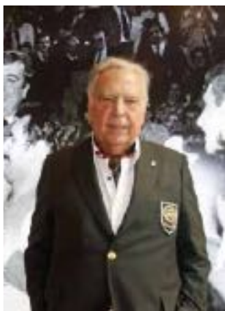
07/07/2022 Pedro Ferrándiz

Entrenador del Real Madrid durante 13 temporadas (de 1959 a 1975), en las que conquistó 4 Copas de Europa, 12 Ligas y 11 Copas de España. También fue seleccionador nacional. Falleció a los 93 años en Alicante.