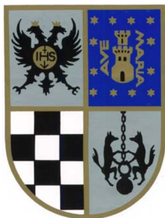
NTRA. SRA. DEL RECUERDO