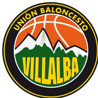
U.B. VILLALBA BUZO SALAO