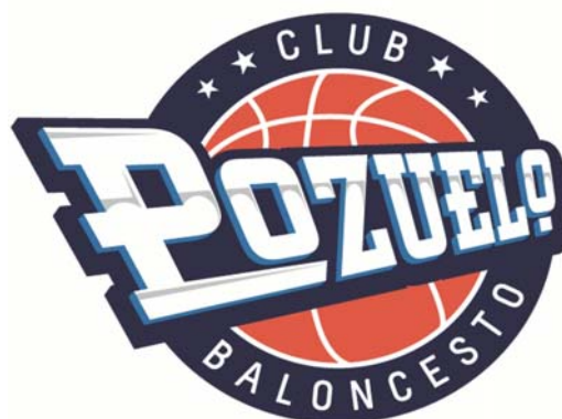
POZUELO C.B. 'C'