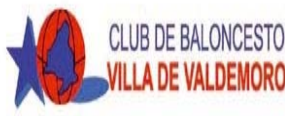
VILLA DE VALDEMORO