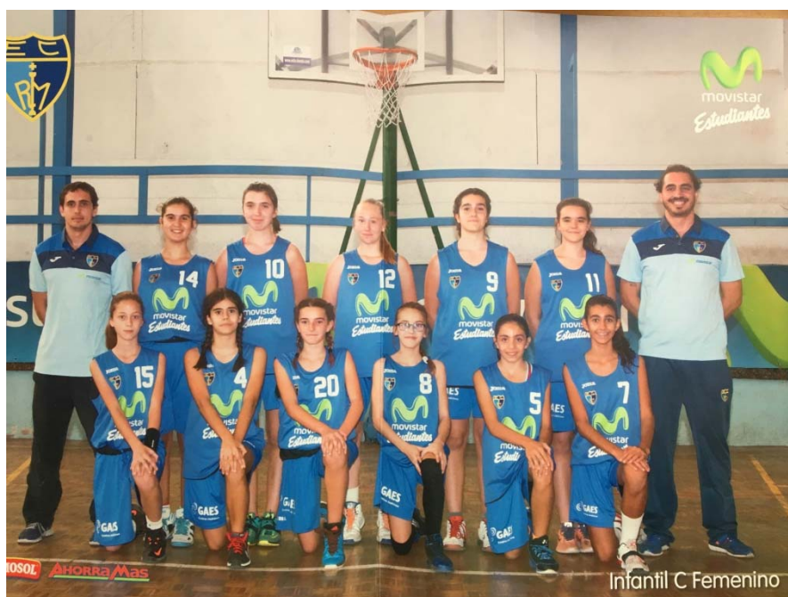
Infantil C Femenino