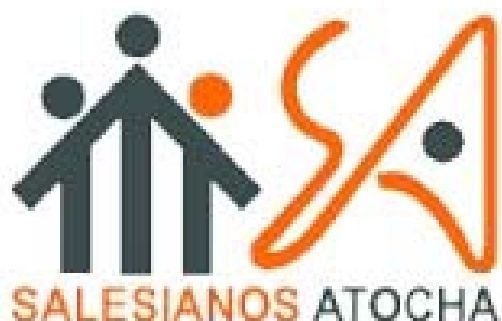
SALESIANOS DE ATOCHA ‘A’