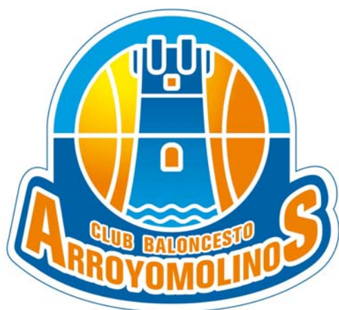
ARROYOMOLINOS C.B. AZU