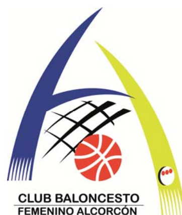
FEMENINO ALCORCÓN AMARILLO