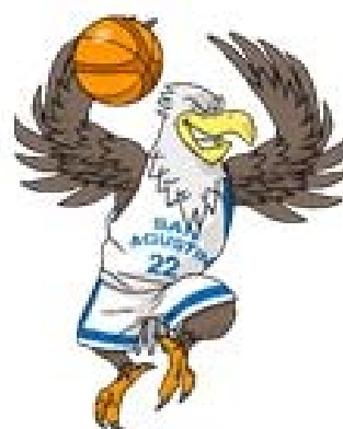
SAN AGUSTÍN MADRID A