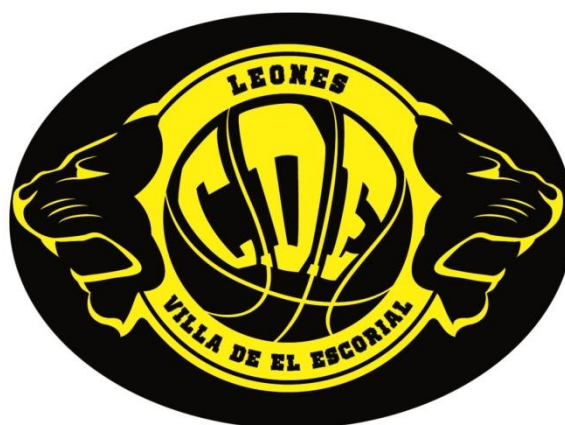
LOS LEONES DE EL ESCORIAL