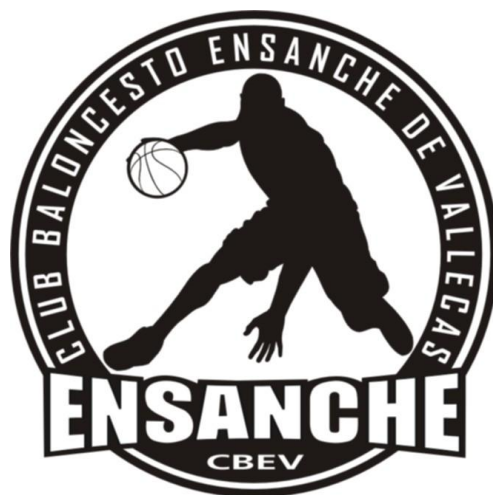
ENSANCHE DE VALLECAS REYWAL