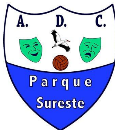
RIVAS P. SURESTE 'B'