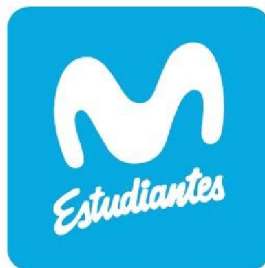
MOVISTAR ESTUDIANTES “A”