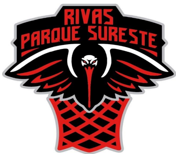
RIVAS PARQUE SURESTE “A”