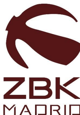
ZENTRO BASKET MADRID