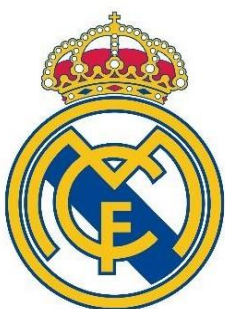
Realmadrid Baloncesto REAL MADRID "A"