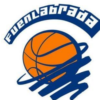
C.B. FUENLABRADA "A"